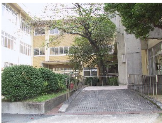
府立盲学校