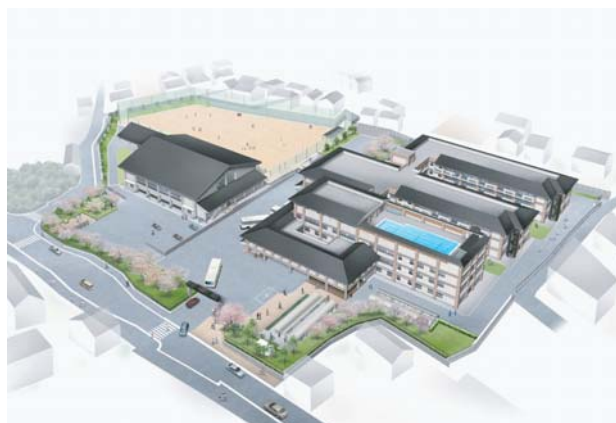
府立宇治支援学校（同校の学校案内より）